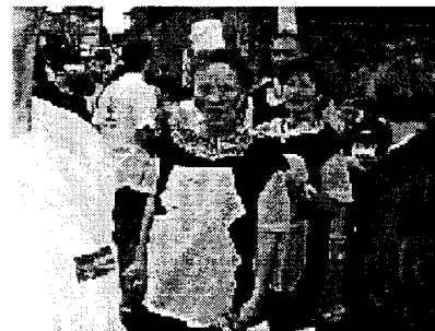
ARRIVEE DE LA TRANSABERIEENNE à l'Aber-Wrach